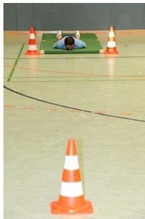
Abb. 5: Aufbau des Sprinttests

Zwei Gymnastikmatten werden hintereinander mit ihrer schmalen Seite an eine Hallenwand längsseitig der Halle platziert, sodass ein Verrutschen beim Aufstehen vermieden wird und ausreichend Auslauf vorhanden ist. Gemessen von der vorderen Mattenkante wird in 10 m Entfernung eine Pylone mit deren Mittelpunkt mittig aufgestellt. Diese stellt den Wendepunkt und die Zielmarkierung des Sprinttests dar (Abbildung 5). Zwei weitere Markierungspylenen sind mit den Mittelpunkten an der Mattenvorderkante auszurichten und stehen unmittelbar links und rechts neben der vorderen Mattenkante.