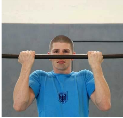
Abb. 7: Testabbruchkriterium beim Klimmhang: Das Kinn sinkt unter das Niveau der Reckstange