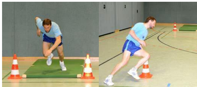
Abb. 4: Laufweg nach Verlassen der Bauchlage sowie das Umlaufen des Wendepunktes

Die Testperson muss nach den zuvor beschriebenen Kriterien fünfteinhalb Runden absolvieren, d. h. sechs Mal von der Matte aufstehen, um die Pylone sprinten und sich wieder hinlegen. Nach dem sechsten Aufstehen ist nur noch der einfache Weg zur Pylone zu laufen. Bei Erreichen des Wendepunktes wird die Zeit gestoppt. Die benötigte Zeit in Sekunden, Zehntelsekunden wird im Nr. 2 des Erfassungsblattes (Muster Anlage 5.4) eingetragen.