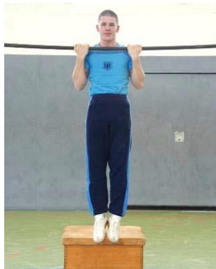
Abb. 6: Testperson beim Klimmhang: Die Hände werden im Kammgriff gehalten, die Unterarme sind maximal gegen die Oberarme gebeugt

Zur Einnahme der Startposition steht die Testperson zunächst auf einem kleinen Kasten und greift im Kammgriff (Handrücken zeigt vom Körper weg) an die vor ihr befindliche Reckstange. Dabei soll die Griffweite der Hände (bezogen auf die Handmitte) etwa der Schulterbreite entsprechen. In dieser Anfangsposition befinden sich die Schultern ungefähr auf gleicher Höhe mit der Reckstange. Die Unterarme sind möglichst weit in Richtung Oberarme gebeugt (Abbildung 6). Der Start erfolgt unmittelbar nach Aufforderung durch den Testleiter bzw. die Testleiterin. Hierzu verlässt die Testperson den Sprungkasten und verharrt in der Endposition eines Klimmhangs (Ellenbogengelenk maximal gebeugt, Schultern auf Höhe der Reckstange).