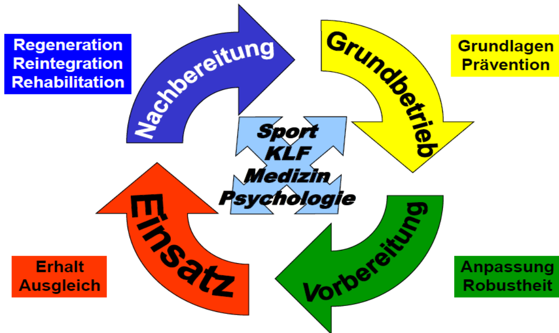
Abb. 2: Ausrichtung der psychophysischen Leistungsfähigkeit an den Phasen des militärischen Dienstes

Das Training der KLF muss dabei in allen Phasen des militärischen Dienstes spezifisch ausgerichtet und gestaltet werden (siehe Abbildung 2).