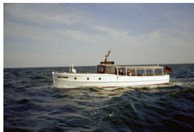
Optional bei starker Beteiligung: