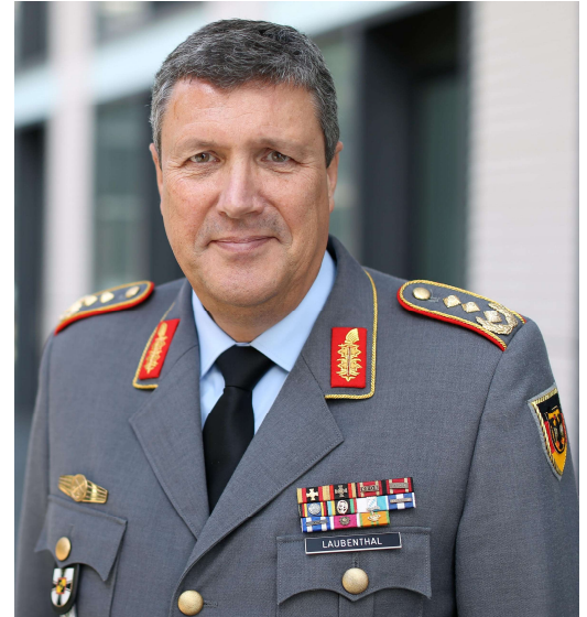
Generalleutnant Markus Laubenthal

Von 1983 bis 1985 begann er die Ausbildung zum Reserveoffizier und Offizier der Panzertruppe an der Offizierschule des Heeres in Hannover und der Panzertruppschule in Munster.