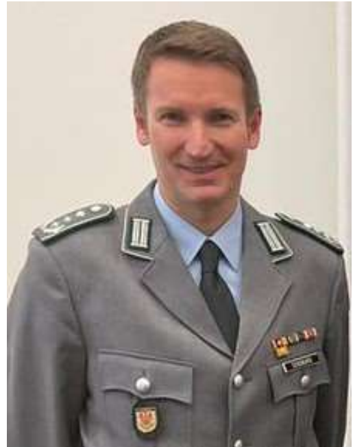
Oberst d.R. Prof. Dr. Patrick Sensburg

Nach dem Abitur 1991 leistete er seinen Wehrdienst und durchlief die Ausbildung zum Reserveoffizier.