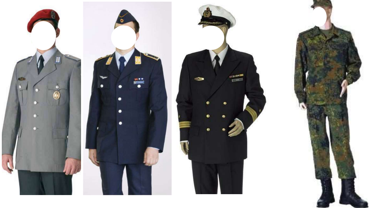
Dienstanzug Heer / Luftwaffe / Marine

Eine UTE muss grundsätzlich vom Ausführenden der Veranstaltung beantragt werden.