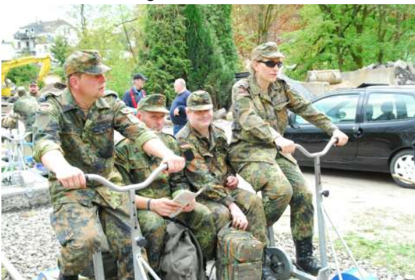
Reservisten der Kreisgruppe Bergisch Land

Die Veranstaltungsdauer ist mit ca. 2.5 Stunden großzügig bemessen, kleine Verschnaufpausen sind immer drin. Wir garantieren Ihnen, Sie werden dieses Erlebnis gerne weiter erzählen.