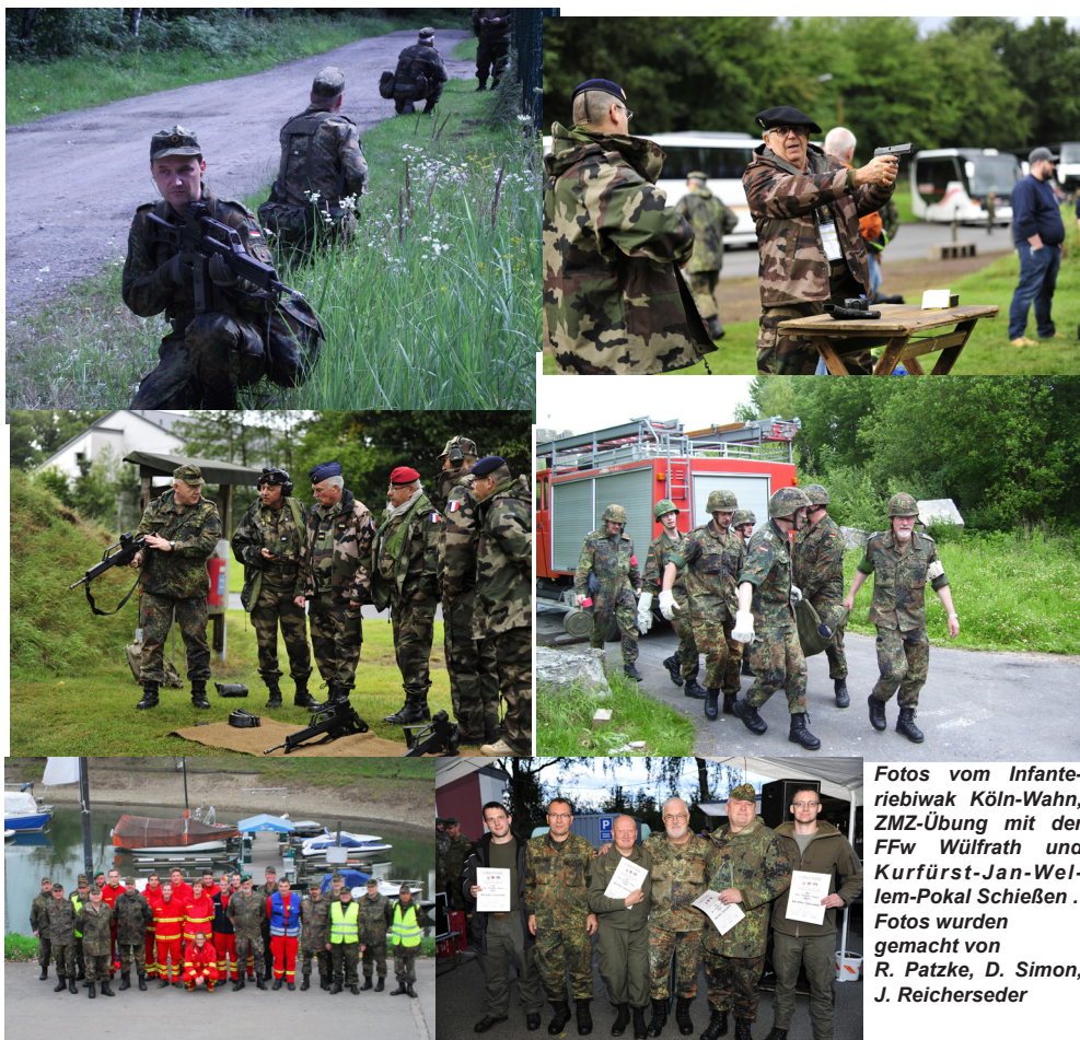
Fotos vom Infanteriebiwak Köln-Wahn, ZMZ-Übung mit der Fw Wülfrath und Kurfürst-Jan-Wellem-Pokal Schießen .