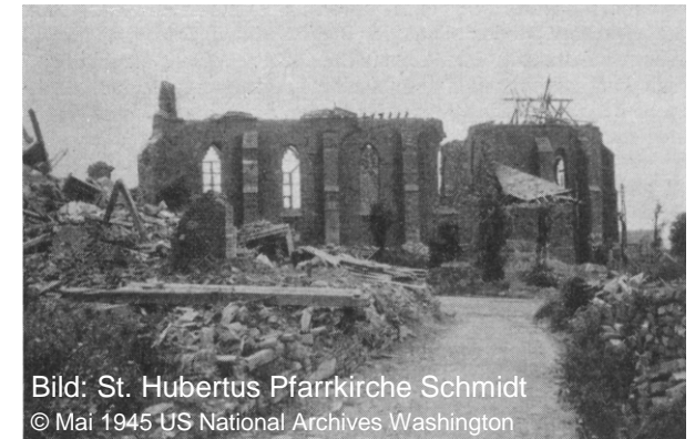
Bild: St. Hubertus Pfarrkirche Schmidt © Mai 1945 US National Archives Washington

Militärhistorischer Arbeitskreis Reservistenarbeitsgemeinschaft (RAG) Marine Euskirchen Marinekameradschaft (MK) Euskirchen von 1927 Reservistenkameradschaft (RK) Euskirchen