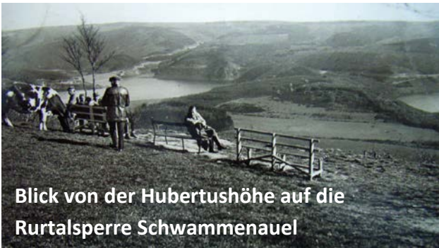
Blick von der Hubertushöhe auf die Rurtalsperre Schwammenauel