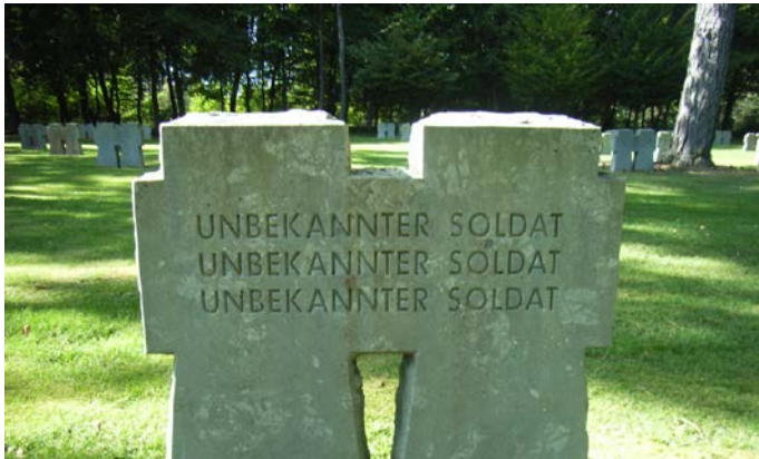
Bild: Kriegsgräberstätte Hürtgen (ehem. Minenfeld "Wilde Sau")

Dem Gedenken an die Opfer, der Völkerverständigung und der Mahnung zum Frieden sollen die Wanderungen auf historischen Wegen auch mehr als 75 Jahre nach dem Ende der Auseinandersetzung erinnern.