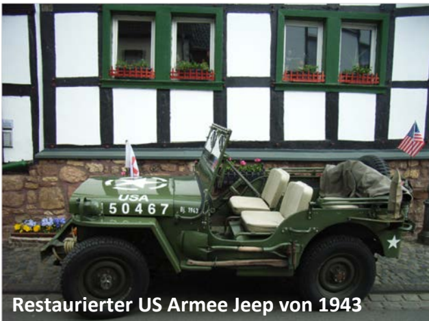
Restaurierter US Armee Jeep von 1943