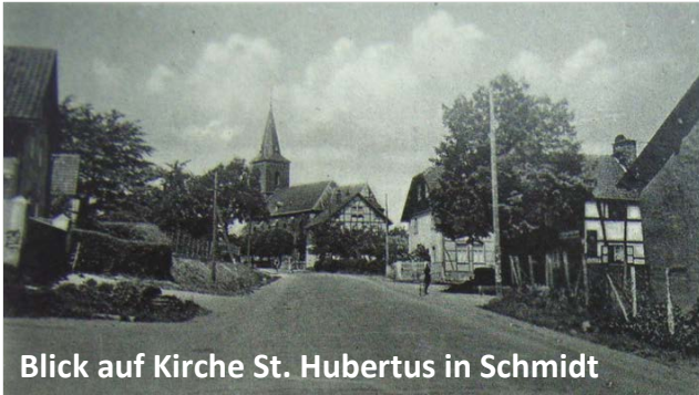
Blick auf Kirche St. Hubertus in Schmidt