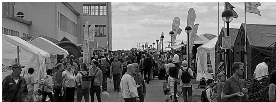
Tag der Reserve 2022

Für nähere Informationen wenden Sie sich bitte an die Geschäftsstelle