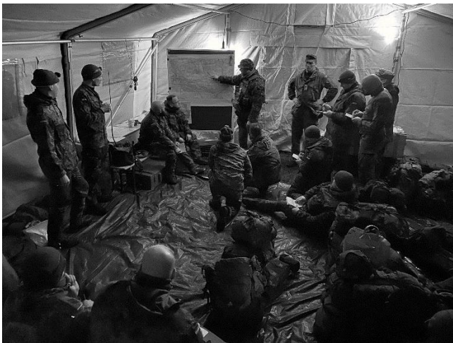
Übung von Berliner Reservisten beim Eiswolf-Landesgruppe SH

Für nähere Informationen wenden Sie sich bitte an die Geschäftsstelle.